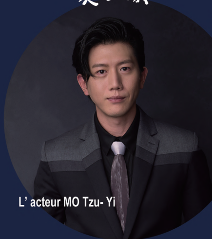
L'acteur MO Tzu-Yi

MO Tzu-Yi, acteur tout terrain et scénariste d'un esprit profond. Il remporte à 39 ans en 2020 le prix du meilleur acteur au Golden Horse Film Festival dans le film «Dear Tenant».