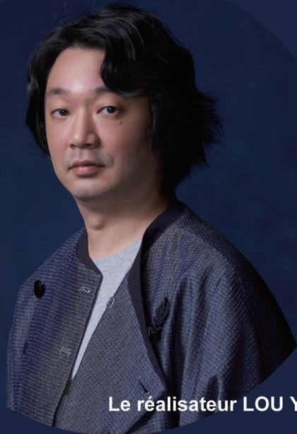
Le réalisateur LOU Yi-An